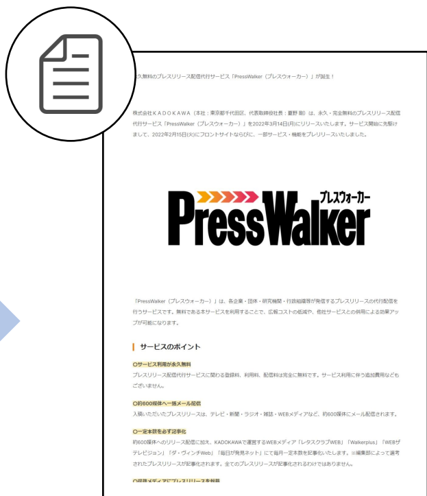
プレスリリース サンプル